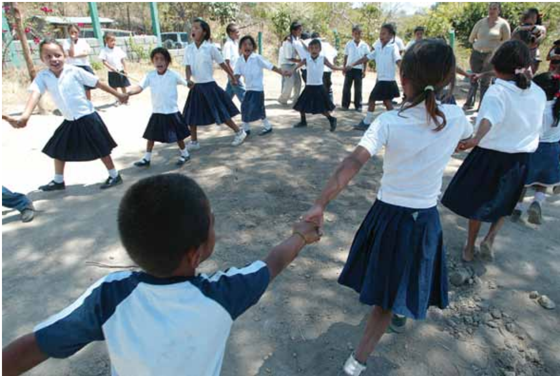
Elmer Martínez / WFP - Honduras