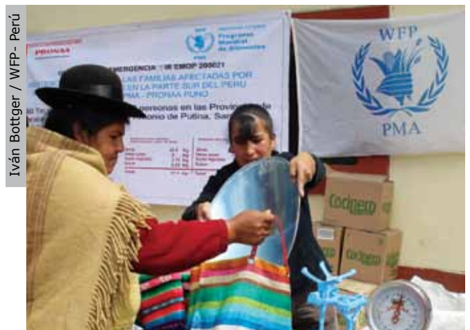
Iván Bottger / WFP- Perú