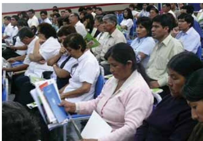
Lanzamiento regional del portal web NUTRINETPERÚ en el departamento de Tacna.