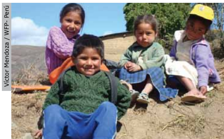
Niños beneficiarios Proyecto: "Promoción del Desarrollo Sustentable en microcuencas alto andinas PER 06240.0"- Ayacucho.