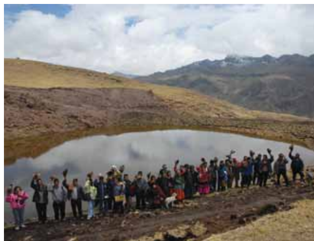
Monica San Martín / WFP - Perú