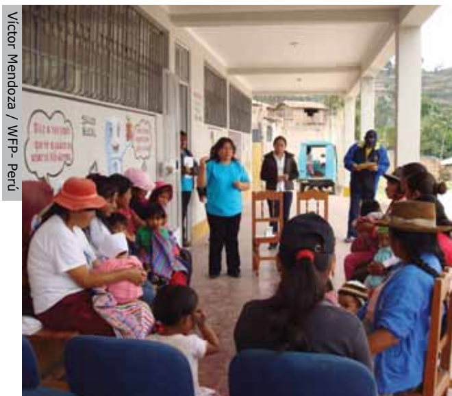
Taller capacitación sobre el uso y beneficios de los multimicronutrientes, Ayacucho.