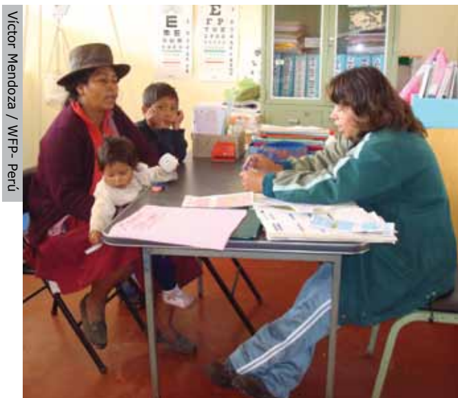
Madre beneficiaria recoge dosis de multimicronutrientes en centro de salud en Ayacucho, en el marco del "Plan Nacional de implementación de multimicronutrientes".