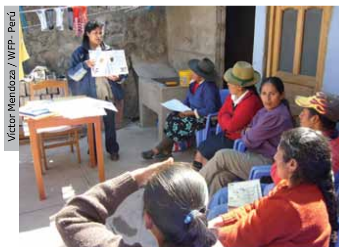
Víctor Mendoza / WFP - Perú