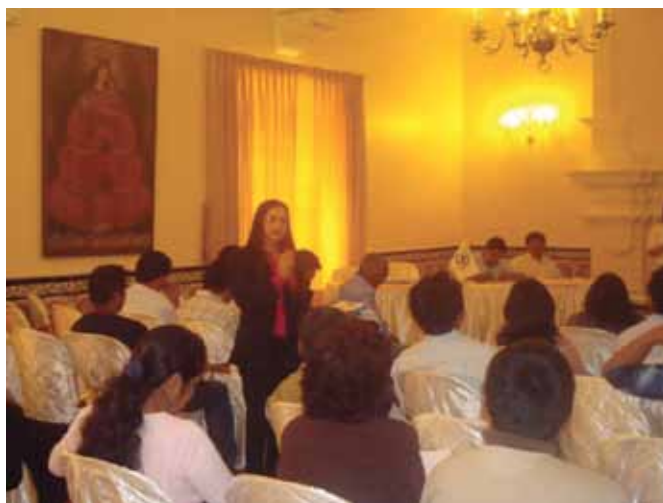
Lanzamiento del portal web NUTRINETPERÚ en el departamento de Ayacucho.