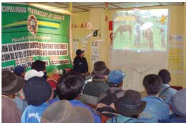
Taller de capacitación de técnicas de manejo de cultivos a beneficiarios Proyecto: "Promoción del Desarrollo Sustentable en microcuencas alto andinas PER 06240.0" - Ayacucho

El PMA continuará apoyando con asistencia técnica y en el proceso de articulación interinstitucional esta decisión del gobierno del Perú, a través del Ministerio de Agricultura.