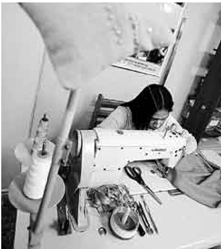
MANOS TRABAJADORAS. Las chicas empezaron a coser como una terapia contra la depresión, hoy quieren sacar adelante su microempresa.